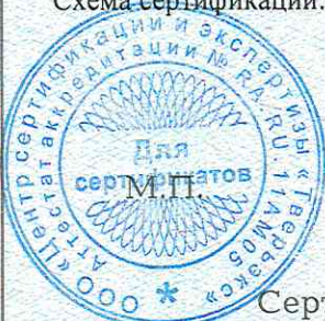
Схема сертификации: Ic